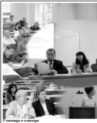
Участници в семинара

проучване за състоянието на професионалния учен, по Нова телевизията ще има 6 излъчвания на продуцирания „Хай Тек“. Основната цел на проекта REKS е да покаже на нашите съвременни важната роля на ученията на иновации и България на иновации и обхващащо на цялостно като част от европейските тенденции.